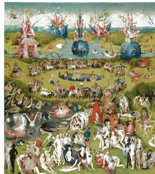
Hieronymus Bosch. Garden of Earthly Delights, c. 1503

ИСТОРИЯ НА ЗАПАДНАТА ФИЛОСОФИЯ Двама мъже – Еразъм и сър Томас Мор – са типични представители на северния Ренесанс. И двамата са образовани; и двамата презирали схоластичната философия; и двамата имали за цел осъществяването на дълбока вътрешна реформа на духовенството, но осъдили протестантската схизма; и двамата са остроумни, темпераментни и изключително умни писатели. Нито Еразъм, нито Мор са философи в точния смисъл на думата, но илюстрират духа на предреволюционната епоха, когато съществува едно широко разпространено разбиране за необходимостта от умерена реформа.