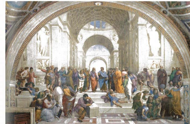
Raphael. School of Athens, 1509

7 Ренесансът възражда изучаването на Платон и по такъв начин успява да отвоюва известна независимост най-малкото по отношение на избора между него и Аристотел. Той осигурява също така възможността за неподправено познание от първа ръка на тези автори, изчистено от тълкуванията на неоплатониците и арабските коментатори. И което е още по-важно – Ренесансът насърчава навика на интелектуалната дейност да се гледа като на възхитително обществено приключение, а не като на отшелническо съзерцание, целящо съхраняването на предопределената ортодоксия.