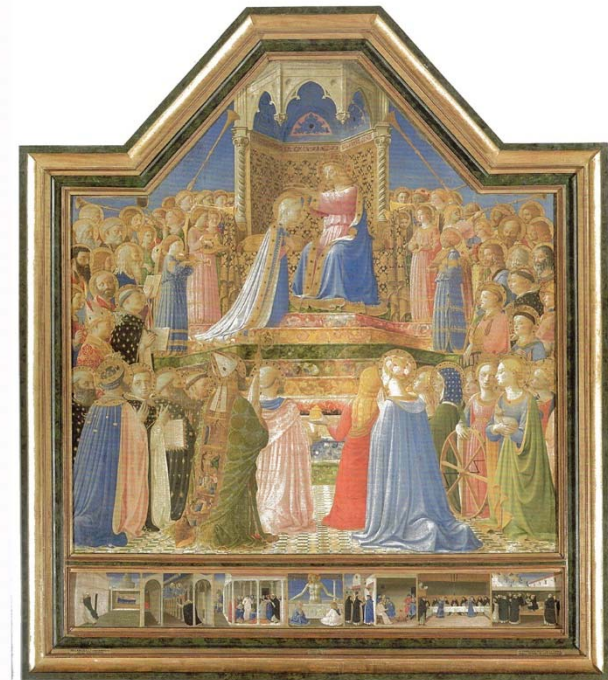
Fra Angelico. The Coronation of the Virgin, c. 1430-32

Петрарка и Бокачо от XIV век принадлежат духом към Ренесанса, но във водовъртежа на политическите условия тяхното пряко въздействие е незначително в сравнение с това на хуманистите от XV век.