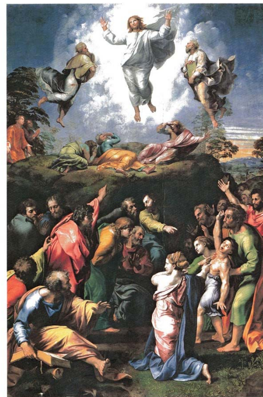
Raphael. The Transfiguration, 1518/20