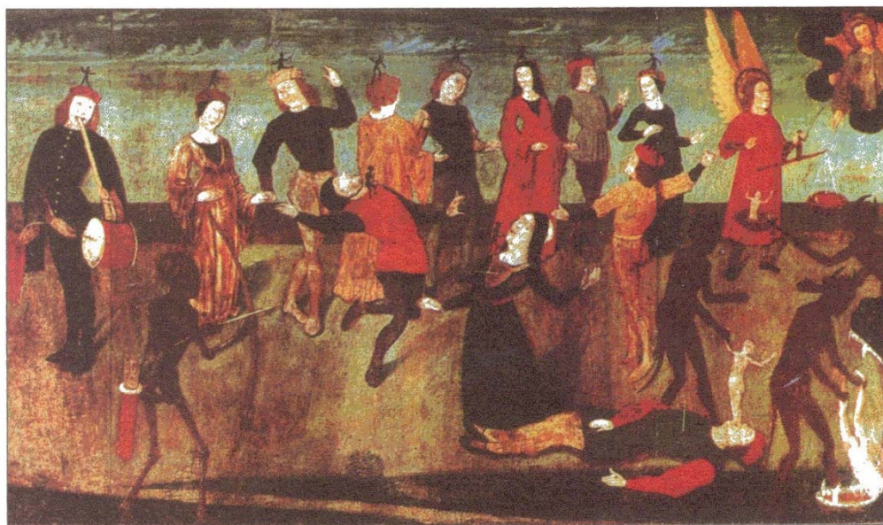
Мъртвешки танц. Льо Бар-сюр-Лу, Вар (Le Bar-sur-Loup, Var) (XV в.): дяволчетата стрелят със стрели по танцьорите и ги запокитват в пастта на ада.

В бретонската църква в Кермария (1460) всеки един от персонажите е представен отделно, фронтално, в една ниша, но държи за ръка съседите си като в танц. [...] Повечето мъртвешки танци приличат на шествие, в което мъртвите вървят пред живите и ги водят. Така е в бенедектинската абатска църква в Ла Шез-Дийо (ок. 1470) или в Ла Ферте-Лупиер в Ион (1471), където всеки от мъртъвците влачи един жив в нещо, което повече прилича на процесия, отколкото на танц.