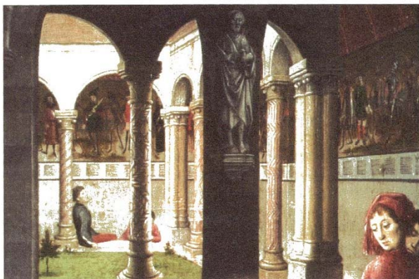
Симон Мармион. Сцени от живота на свети Бертен, детайл от Задния олтар на Сент-Омер (1459). Берлин, Галерия за изкуство, кат. №1645 А: миряни обсъждат мъртвешкия танц, нарисуван в манастира, и размишляват за смъртта.

Но все пак съществува едно изображение на мъртвешкия танц, което показва и неговите зрители, и по този начин ни позволява да придобием известна преценка за техните реакции: на едно от двете крила на задния олтар на „Сент-Омер“, където е представен „Животът на св. Бертен“, нарисуван през 1459 от Симон Мармион [...] Следователно мъртвешкият танц има широка амплитуда, надхвърляща реалния танц, която се отнася до ритъма на целия човешки живот, до неговия несигурен край, до продължението му в отвъдното.