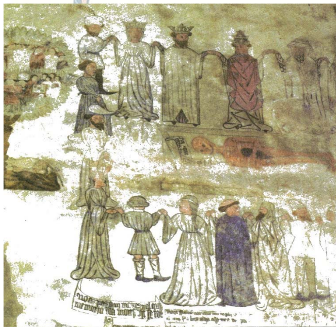
Мъртвешки танц. Морела, заседателна зала на манастира „Свети Франциск“ (началото на XV в.).

Известни са над петдесет изображения на мъртвешкия танц от XV и началото на XVI век. Формите им са разнообразни. Стенописът от заседателната зала на манастира „Св. Франциск“ в Морела, Испания (началото на XV в.) показва истинското хоро, в което папата, двама крале, един кардинал и един епископ, монаси, миряни от различни съсловия се държат за ръка и танцуват около вкочанен труп, положен в ковчег. Това необичайно изображение е свършено независимо от традицията на Гийо Маршан, който предпочита групите от един жив и един мъртъв, застанали лице в лице и разделени отчетливо от ясно видимите аркади на гробището на Невинните. [...]